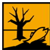
N - Dangereux pour l'environnement