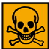
T+ - Très toxique